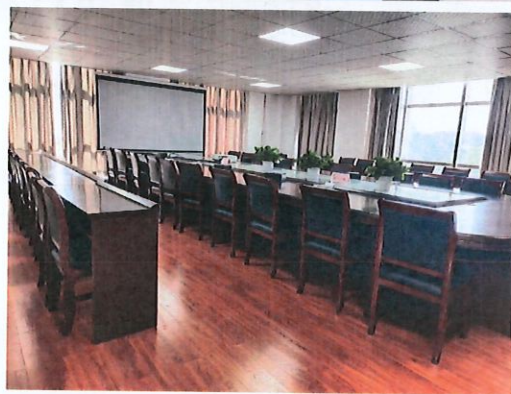
总承包项目部照片